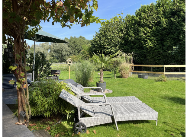
Ruheoase mit Pferden im Garten Wohnung EG rechts