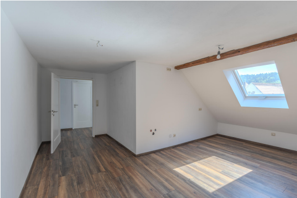
2. OG Wohnung