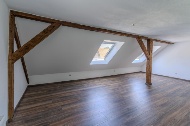
2. OG Wohnung Schlafzimmer