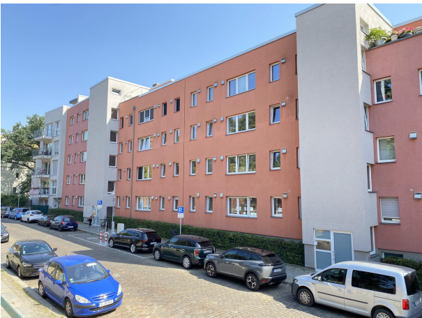
Blick zur Straße